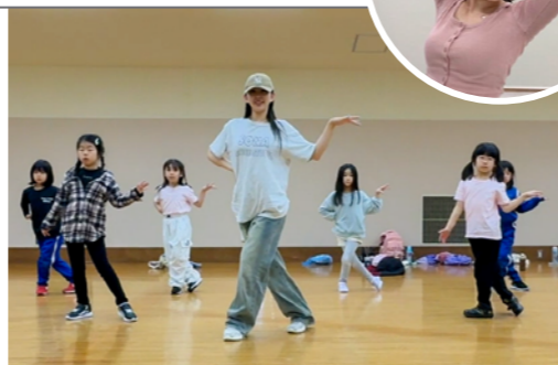
講師 SONA 高校1年から Girl's HIPHOP を始め、韓国の有名スタジオにダンス留学経験有り 2020年より SONA DANCE STUDIO を設立し代表兼講師を務める

最近、注目が集まっている「K-POP」。韓国女性アイドルが踊る Girls HIPHOP を K-POP の音楽をメインに踊るクラスです。かわいくカッコいいダンスに加え、かわいい衣装やメイクで只今、人気沸騰中です！Girls HIPHOP は、その名の通り女性が踊る HIPHOP で、特徴としては女性らしい曲線をいかしてセクシーさやキュートさをアピールしながら踊ります。使用する音楽は大人気の K-POP アイドルの曲が中心になるので、みんなが大好きな音楽でそれだけで楽しい！、嬉しい！！クラスです。定期的に練習したダンス動画を SNS にアップしますので、是非、チェックしてください。