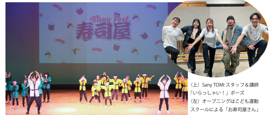
(上) Sany TOMI スタッフ & 講師「いらっしゃい!!」ポーズ (左) オープニングはこども運動スクールによる「お寿司屋さん」

STUDIO EAST SONA Dance Studio CBS 上田 LoveYourselfStudio