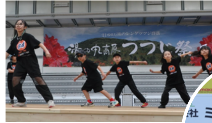
(左) つつじ祭りにて HIPHOP クラス (下) 雷電まつりにて Girls HIPHOP クラス

次の発表の場はSany TOMI 最大のイベント「Sany Fest. 2025」です。2025年2月2日(日)に開催予定ですので、ご興味のある方はお問い合わせください。