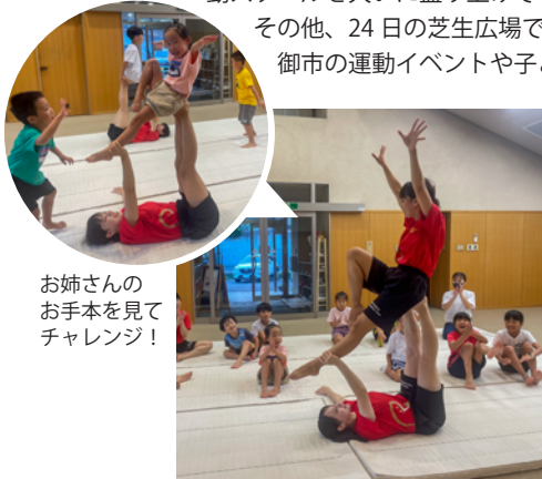
お姉さんのお手本を見てチャレンジ！

普段、合宿にしに来ない学生たちに東御市の良さを知ってもらえる良い機会になったかと思えます！