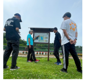
芸術むら公園コース講習

新たに2名がガイド認定を受け、東御市のクアオルト健康ウォーキングのガイドは計6名となりました。クアオルト健康ウォーキングは東御市の生涯学習出前講座で受けられますので、ご興味のある方は東御市健康推進課にお問合せください。