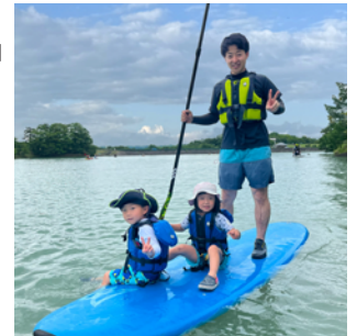
人気のSUP! 親子やお友達と同乗も

今年も沢山のお申込みをいただき、6月～9月開催をしました。座って乗るカヌーや立って乗るSUP(スタンドアップパドル)だ