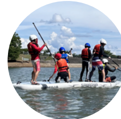
メガSUP 大人数乗艇可！